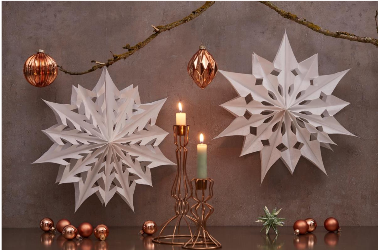
Links: „Filigraner Stern“. Rechts: „Sternenpracht“